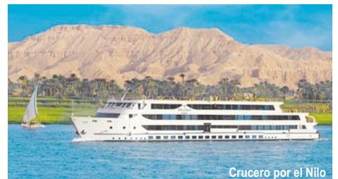
Crucero por el Nilo

Desayuno y traslado al aeropuerto para salir en vuelo de regreso a España . Llegada al aeropuerto de Barajas y Fin del viaje .