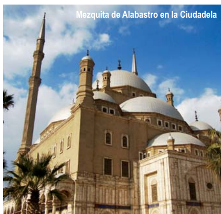
Mezquita de Alabastro en la Ciudadela

Pasaporte con una validez mínima de 6 meses y Visado que se obtiene en el aeropuerto de llegada a Egipto (34 euros aprox.).