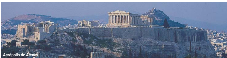
Acrópolis de Atenas