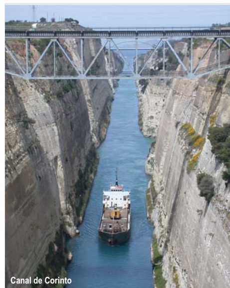
Canal de Corinto

Desayuno. Por la mañana, visita del recinto arqueológico de Delfos : gran número de monumentos y edificios subsisten en la actualidad dando testimonio de su pasada grandeza; y el Museo Arqueológico , uno de los más importantes de Grecia que incluye