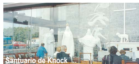
Santuario de Knock

Desayuno irlandés. Mañana libre para ampliar la visita o pasear por la zona georgiana de St. Stephen's Green y Merrion Square. Almuerzo y traslado al aeropuerto de Dublín para salir en vuelo de regreso a Madrid . Llegada al aeropuerto de Barajas y Fin del viaje