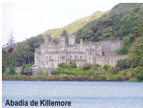
Abadía de Killemore

Desayuno irlandés. Por la mañana, salida hacia Adare , población en la que destaca su calle principal con sus " Cottages ", casas de techos de paja y cuidados jardines. Continuación por Limerick y hacia los impresionantes acantilados de Moher , de 200 m de altura y cerca de 8 km de longitud, desde donde se contempla la más espectacular vista de la costa irlandesa. Almuerzo y recorrido por la inhóspita región de Burren , de gran