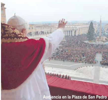
Audiencia en la Plaza de San Pedro