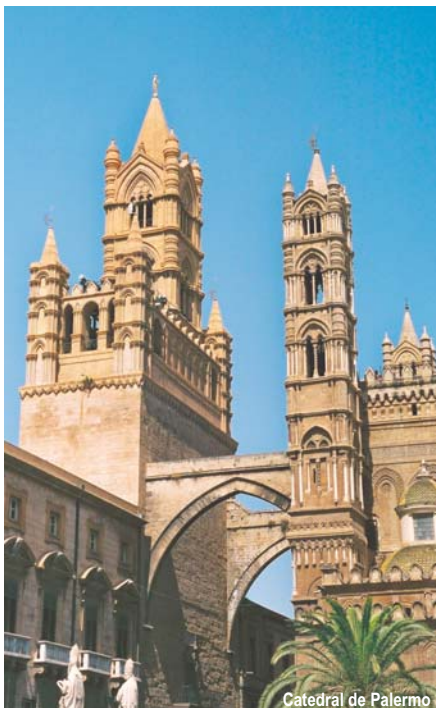
Catedral de Palermo

Desayuno y traslado al aeropuerto para salir en vuelo a Roma . Llegada, cambio de avión, y continuación en vuelo de regreso a Madrid . Llegada al aeropuerto de Barajas y Fin del viaje