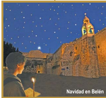
Navidad en Belén

En habit. Doble: 1.275€ Spto. Habit. Individual: 250 €