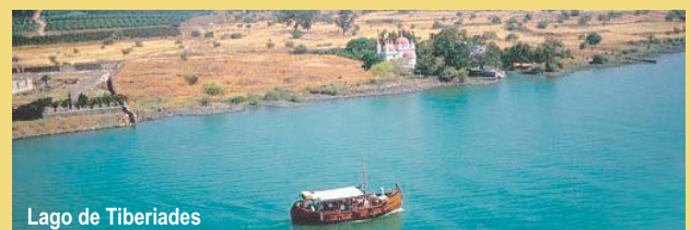
Lago de Tiberiades

Dadas las especiales condiciones de contratación de billetes aéreos y plazas hoteleras, toda anulación de plaza ya confirmada a menos de 8 días de la fecha de salida acarreará la pérdida del importe total. Por este motivo, se recomienda, para cubrir este riesgo, suscribir la póliza que se ofrece (20€) con la Cía. de seguros MAPFRE. Solicite detalle de la misma.