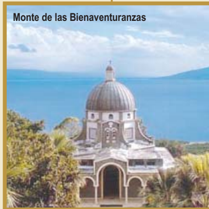
Monte de las Bienaventuranzas

Desayuno y traslado a Abu Gosh (Kiriath Yearim) , lugar del Arca de la Alianza. Tras la visita, regreso a Jerusalén . Almuerzo. Por la tarde, traslado al Apto. y salida a las 16h50 en vuelo IB.3753 a Madrid. Llegada a las 21h15 a Barajas y Fin de la Peregrinación